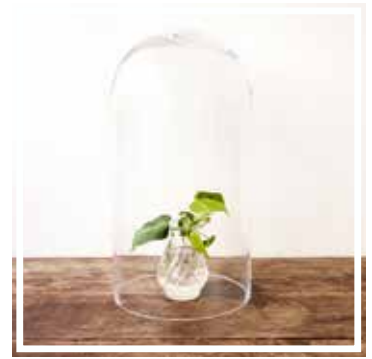
26679 GLASKUGEL GROSSES FORMAT Höhe 44 cm