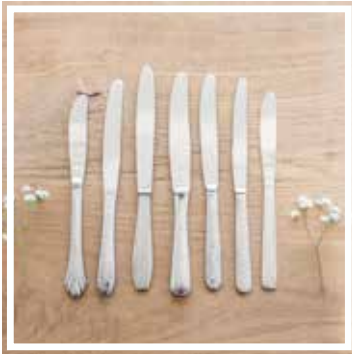
26044 TAFELMESSER INOX