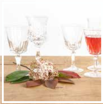
26159 WASSERGLAS KRISTALL Höhe 17-19 cm