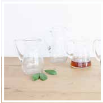
26132 GLASKRUG 1 Liter