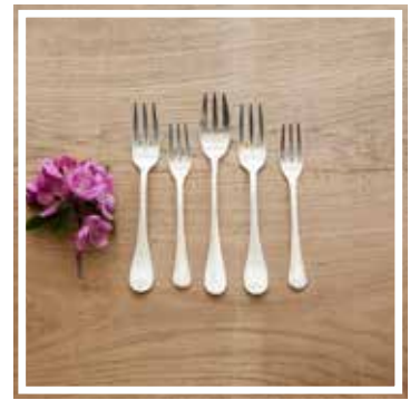
26342 FISCHGABEL INOX