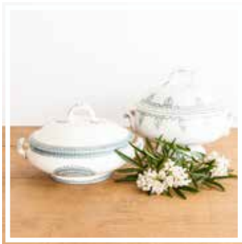
26318 SUPPENSCHÜSSEL BLAU-GRÜN