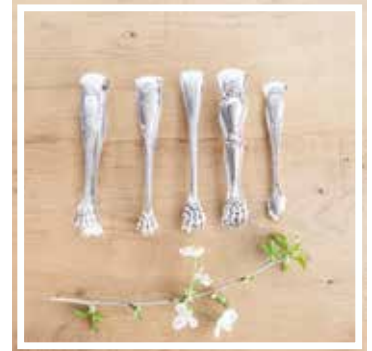
26335 ZUCKERZANGE SILBER