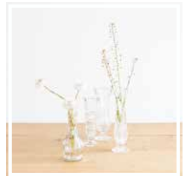
26064 RUNDE VASE Höhe 12-20 cm