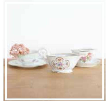
26152 SAUCENSCHALE GEBLÜMT