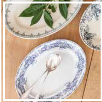
26062 PLATTE OVAL BLAU-GRÜN 32-40 cm