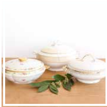
26073 SUPPENSCHÜSSEL GEBLÜMT 24-28 cm