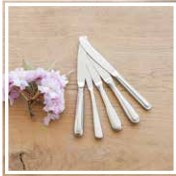
26339 VORSPEISENMESSER INOX