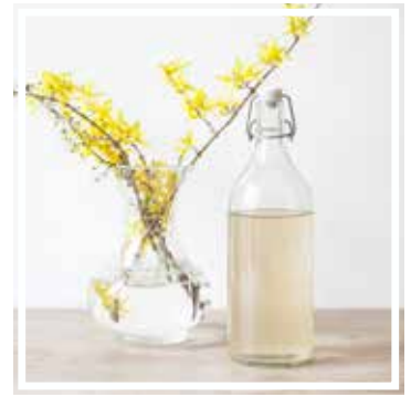
26069 LIMONADENFLASCHE 1 Liter