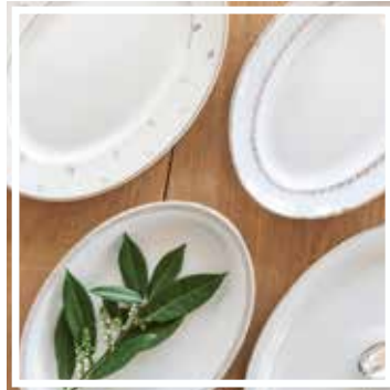
26313 PLATTE OVAL WEISS-GOLD 30-35 cm