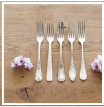
26331 TAFELGABEL SILBER