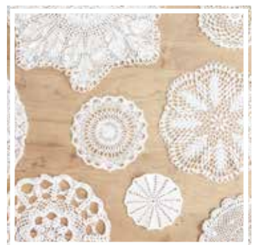
26333 DECKCHEN 10-20 cm