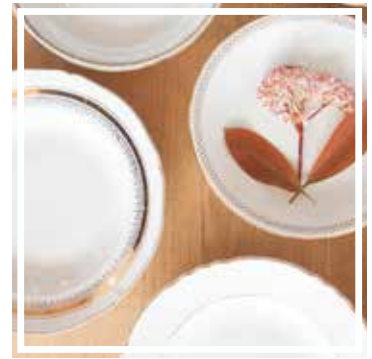
26319 TELLER TIEF WEISS-GOLD 23-25 cm