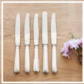
26326 TAFELMESSER SILBER