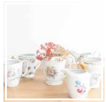
26063 MILCHKRUG GEBLÜMT