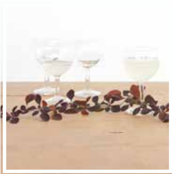
26047 RUNDES WEINGLAS KLASSISCH