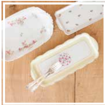
26146 CAKEPLATTE GEBLÜMT 35-40 cm