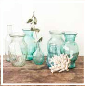
27121 GLASVASE BLAU Vereinzelte Modelle