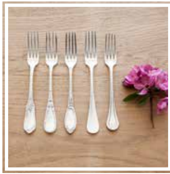
26332 VORSPEISENGABEL SILBER