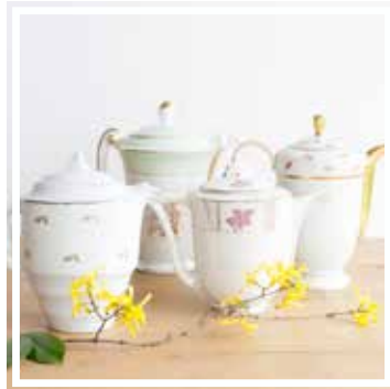
26066 TEEKANNE GEBLÜMT