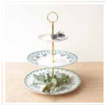
26351 ETAGERE 3-STÖCKIG BLAU-GRÜN Höhe 30-35 cm