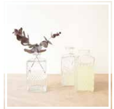
26322 WHISKYKARAFFE 1 Liter