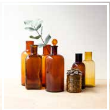
26617 APOTHEKERGLAS BRAUN GROSSES FORMAT Höhe 20-24 cm