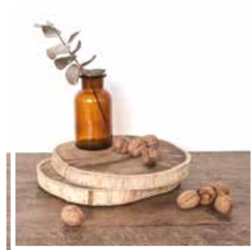
26821 HOLZSCHEIBE GROSSES FORMAT 36-40 cm