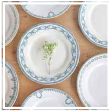
26071 TELLER BLAU-GRÜN KLEIN 18-21 cm