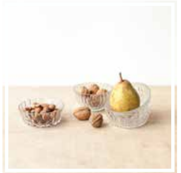
26449 GLASSCHALE 10-11 cm