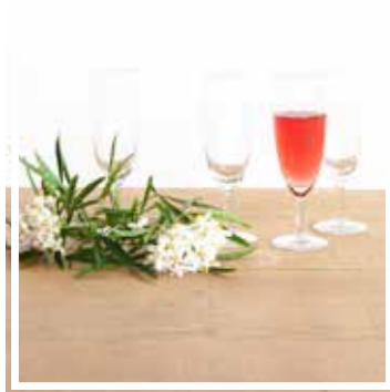
26039 CHAMPAGNERGLAS KLASSISCH