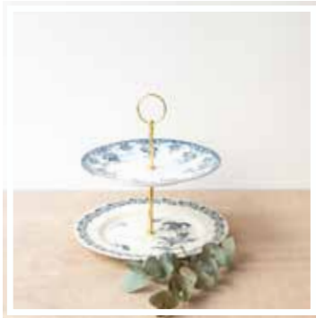
26350 ETAGERE 2-STÖCKIG BLAU-GRÜN Höhe 20-22 cm