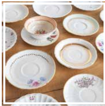
26154 UNTERTASSE GEBLÜMT