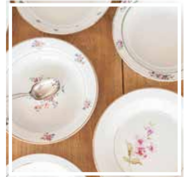
26147 PLATTE TIEF GEBLÜMT 26-30 cm