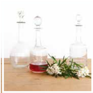
26134 WEINKARAFFE MIT ZAPFEN 1 Liter