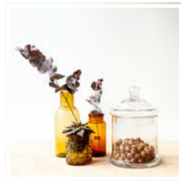
26637 BONBONNIERE GROSSES FORMAT