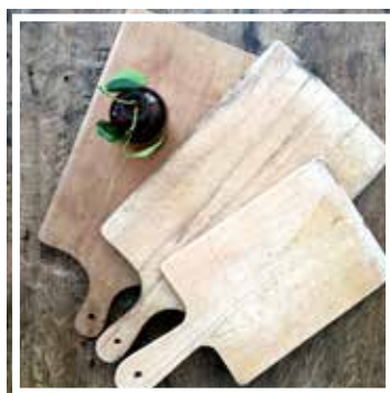
26647 SCHNEIDBRETT AUS HOLZ