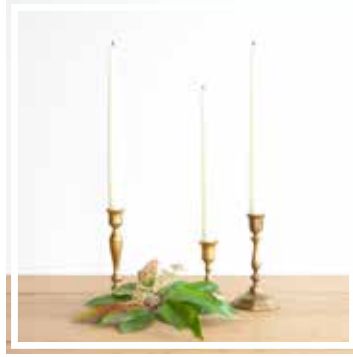
26131 KERZENHALTER KLEIN Höhe 6-12 cm