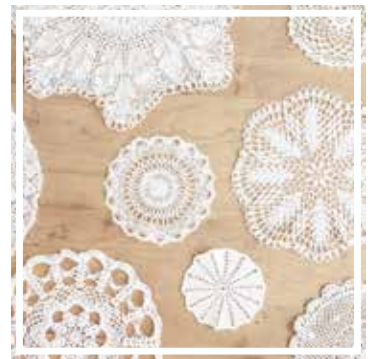
26333 DECKCHEN 10-20 cm