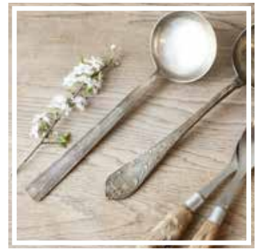
26143 SCHÖPFKELLE SILBER