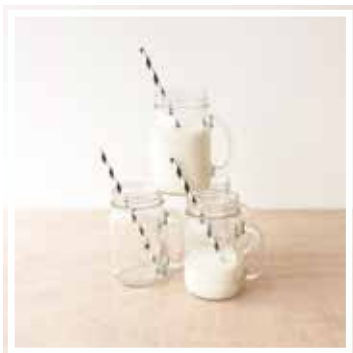
26615 MASON JAR BALL Inhalt 500 ml