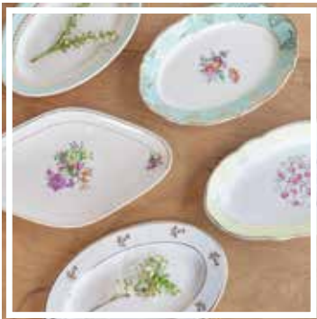
26148 VORSPEISENPLATTE GEBLÜMT 22-24 cm