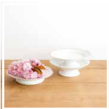
26144 SCHÜSSEL WEISS-GOLD KLEIN 20-24 cm