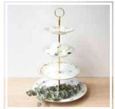
26038 ETAGERE 4-STÖCKIG GEBLÜMT Höhe 40-42 cm