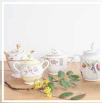
26065 ZUCKERSCHALE MIT DECKEL GEBLÜMT