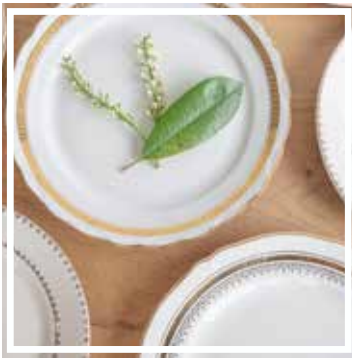
26127 TELLER WEISS-GOLD GROSS 23-25 cm