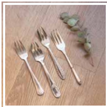
27153 SCHNEIDGABEL SILBER