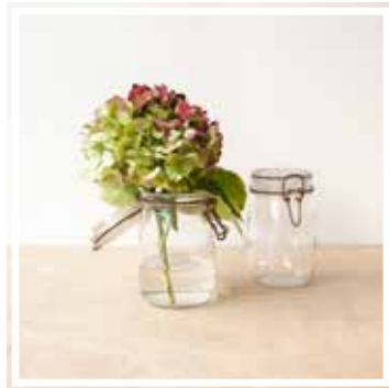
26625 GLAS LE PARFAIT KLEINES FORMAT Höhe 10-14 cm