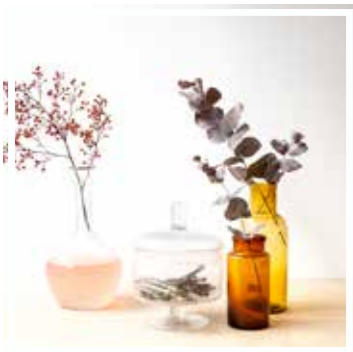
26628 BONBONNIERE KLEINES FORMAT