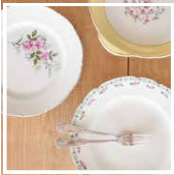
26041 PLATTE GEBLÜMT 26-30 cm