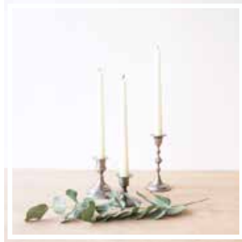
26641 KLEINER KERZENSTÄNDER VERSILBERT Höhe 6-12 cm