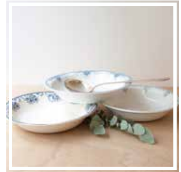
26346 SCHÜSSEL TIEF BLAU-GRÜN 26-30 cm