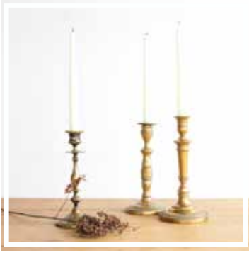
26130 KERZENHALTER GROSS Höhe 18-25 cm