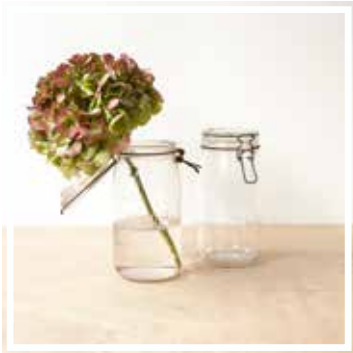
26624 GLAS LE PARFAIT GROSSES FORMAT Höhe 17-20 cm