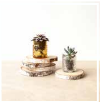
26669 HOLZSCHEIBE MITTLERES FORMAT 23-25 cm