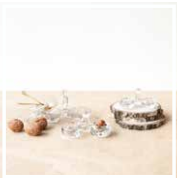
27125 DUO SALZ- UND PFEFFERSTREUER