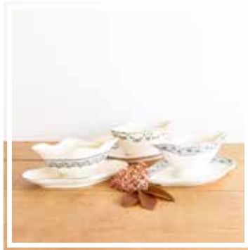
26151 SAUCENSCHALE BLAU-GRÜN