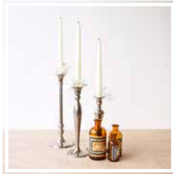
26642 GROSSER KERZENSTÄNDER VERSILBERT Höhe 18-25 cm