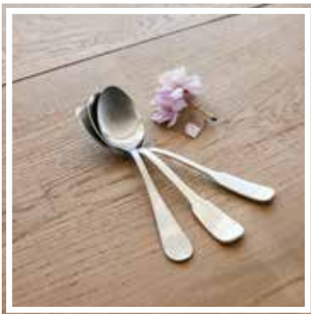
26340 TAFELLÖFFEL INOX