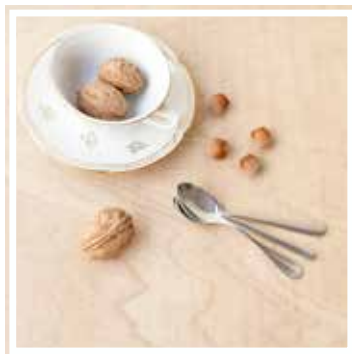
26436 MOKKALÖFFEL INOX