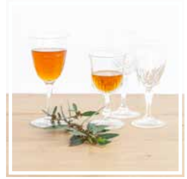
26161 WEINGLAS KRISTALL Höhe 11-15 cm