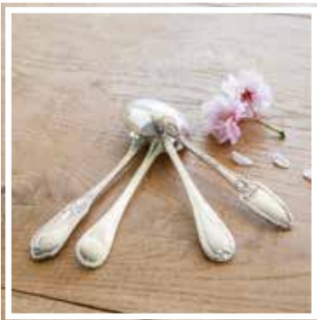
26329 TAFELLÖFFEL SILBER