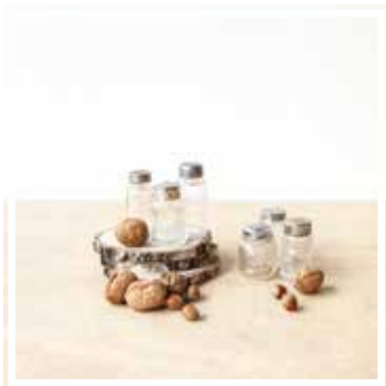
26165 SALZSTREUER & PFEFFERSTREUER