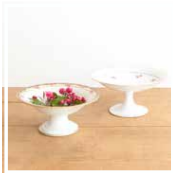
26140 SCHÜSSEL GEBLÜMT GROSS