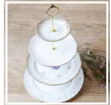
26038 ETAGERE 4-STÖCKIG GEBLÜMT