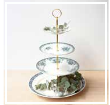
26352 ETAGERE 4-STÖCKIG BLAU-GRÜN Höhe 40-42 cm