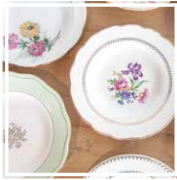
26126 TELLER TIEF GEBLÜMT 23-25 cm