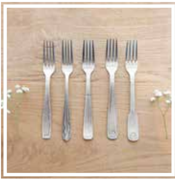
26045 TAFELGABEL INOX