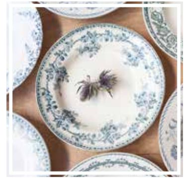
26320 TELLER TIEF BLAU-GRÜN 23-25 cm