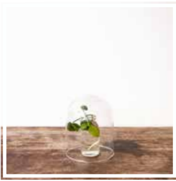
26681 GLASKUGEL KLEINES FORMAT Höhe 16 cm