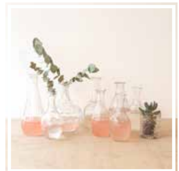
27122 KLEINER BEHÄLTER AUS WEISSEM GLAS Vereinzelte Modelle