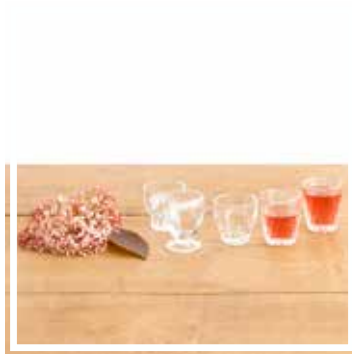
26158 DIGESTIF-GLAS 5-6 cm