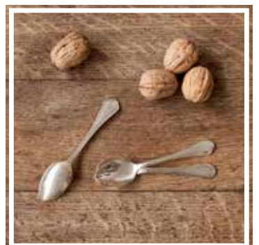
26435 MOKKALÖFFEL SILBER