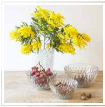
26150 SALATSCHÜSSEL KLEIN