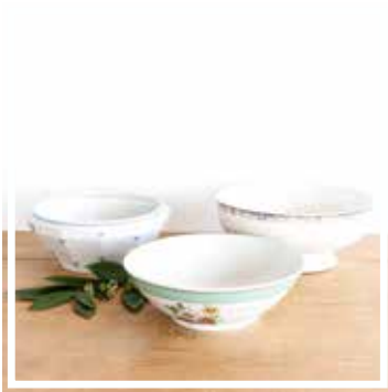
26074 SALATSCHÜSSEL GEBLÜMT 25-28 cm