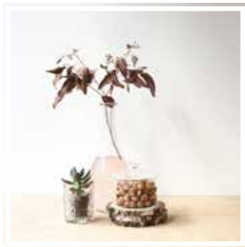
26638 BONBONNIERE KLEINES FORMAT