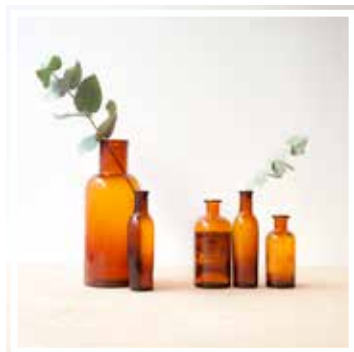
26618 APOTHEKERGLAS BRAUN KLEINES FORMAT Höhe 8-14 cm