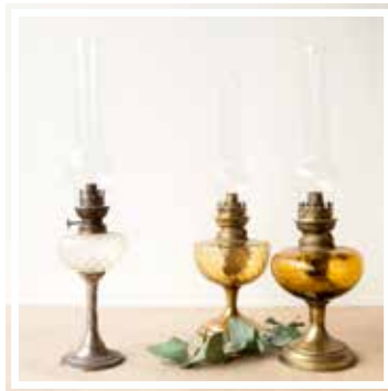
26652 ÖLLAMPE Verschiedene Farben