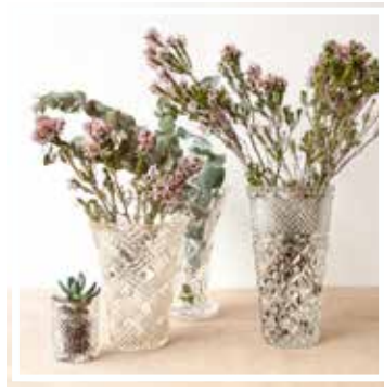
26156 VASE MITTEL Höhe 20-25 cm