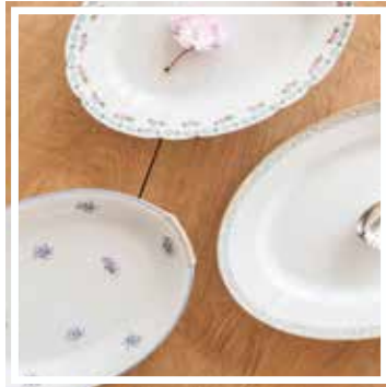
26068 PLATTE OVAL GEBLÜMT 30-35 cm