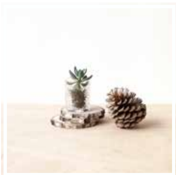
26671 HOLZSCHEIBE KLEINES FORMAT 12-16 cm