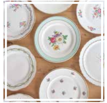
26042 TELLER GEBLÜMT KLEIN 18-20 cm