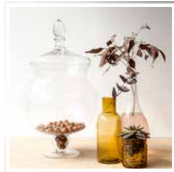
26626 BONBONNIERE GROSSES MODELL