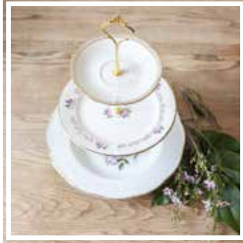
26037 ETAGERE 3-STÖCKIG GEBLÜMT