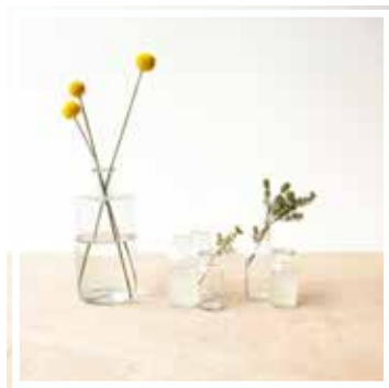
26621 APOTHEKERGLAS WEISS KLEINES FORMAT Höhe 8-16 cm