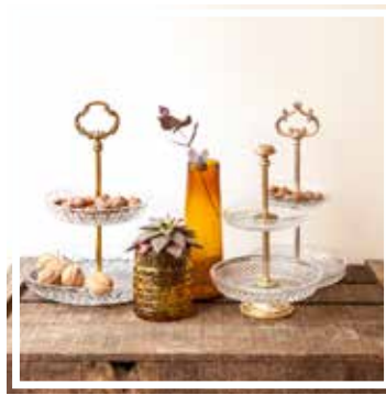
26622 KLEINE GLAS ETAGERE VINTAGE