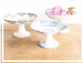
26052 SCHÜSSEL BLAU-GRÜN GROSS 24-26 cm