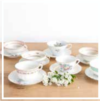
27325 TASSE UND UNTERTELLER GEBLÜMT (Kaffee & Tee gemischt)