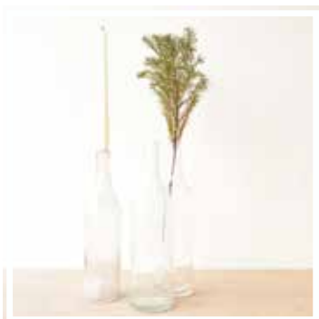
26645 GLASFLASCHE WEISS 1 Liter