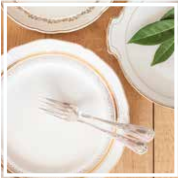
26314 PLATTE WEISS-GOLD 26-30 cm