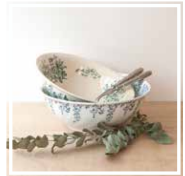
26316 SALATSCHÜSSEL BLAU-GRÜN 28-30 cm