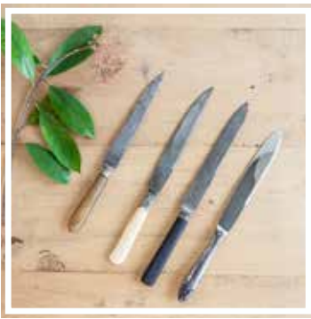
26141 MESSER GROSS