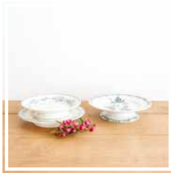
26053 SCHÜSSEL BLAU-GRÜN KLEIN 22-24 cm