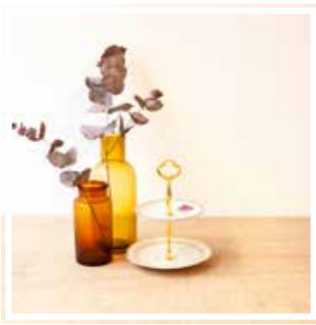
26623 KLEINE PORZELLAN ETAGERE