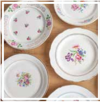
26043 TELLER GEBLÜMT GROSS 23-25 cm