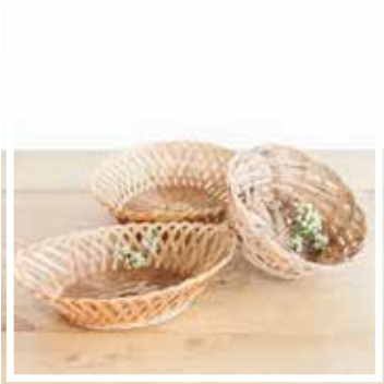
26137 BROTKORB GEFLOCHTEN