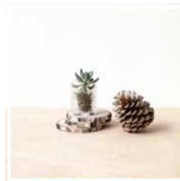
26671 HOLZSCHEIBE KLEINES FORMAT 12-16 cm