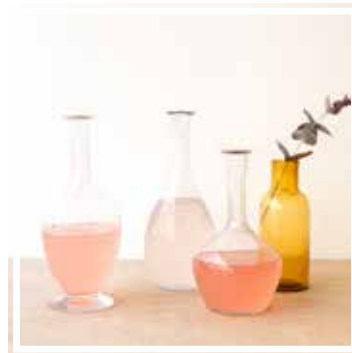
26321 WEINKARAFFE 1 Liter