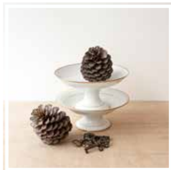
26345 SCHÜSSEL WEISS-GOLD GROSS 22-26 cm