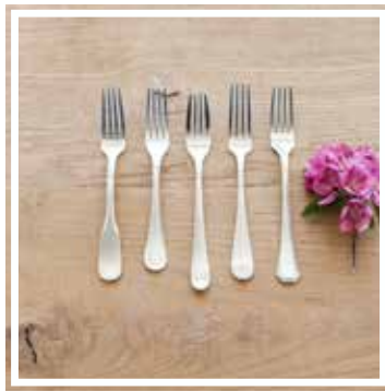
26344 VORSPEISENGABEL INOX