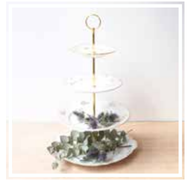
26349 ETAGERE 4-STÖCKIG WEISS-GOLD Höhe 40-42 cm