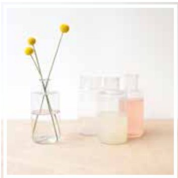
26619 APOTHEKERGLAS WEISS GROSSES FORMAT Höhe 20-22 cm