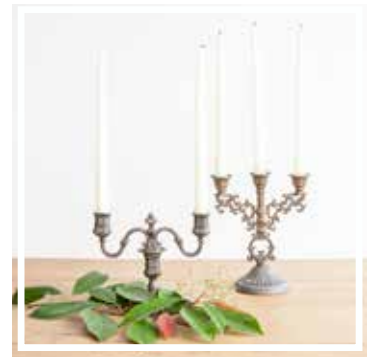
26136 KERZENLEUCHTER GOLD 2 bis 5 Kerzen