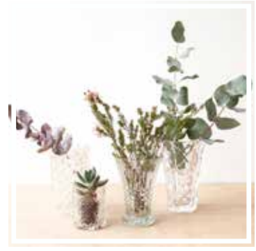
26157 VASE KLEIN Höhe 15-20 cm