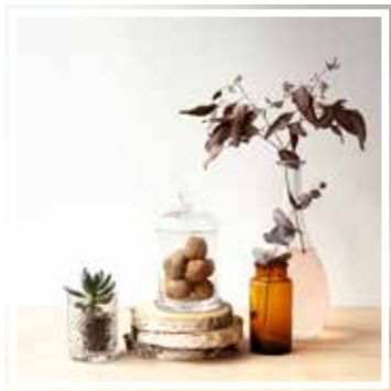
26629 BONBONNIERE MITTLERES FORMAT