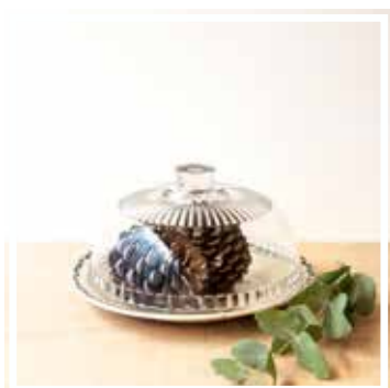
26640 GLASGLOCKE GROSSES FORMAT