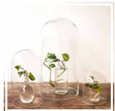
26679 / 26680 / 26681 GLASKUGEL in 3 Grössen erhältlich