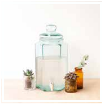
26128 BALLONFLASCHE MIT AUSSCHANK 6.6 Liter