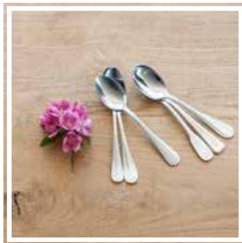
26341 VORSPEISENLÖFFEL INOX