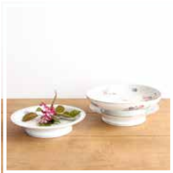
26072 SCHÜSSEL GEBLÜMT KLEIN