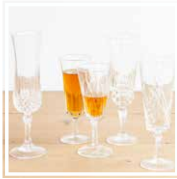
26058 CHAMPAGNERGLAS KRISTALL Höhe 14-16 cm