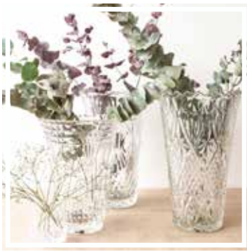
26076 VASE GROSS Höhe 25-30 cm