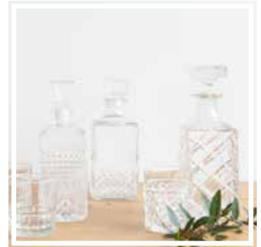
26323 WHISKYKARAFFE MIT ZAPFEN 1 Liter