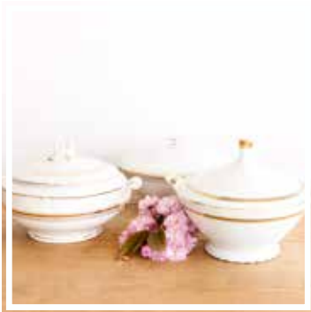
26317 SUPPENSCHÜSSEL WEISS-GOLD 24-28 cm