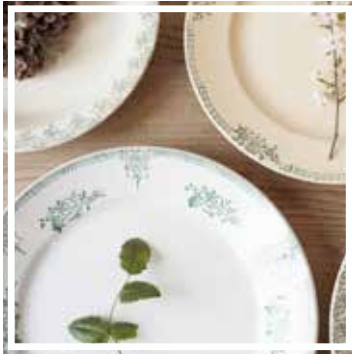
26051 PLATTE BLAU-GRÜN 26-30 cm