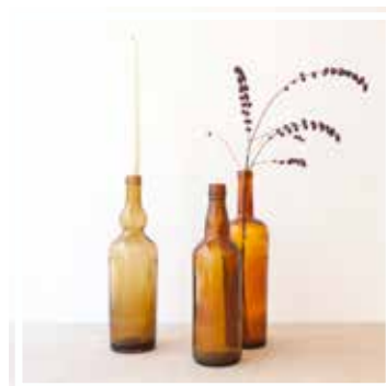
26646 GLASFLASCHE BRAUN 1 Liter