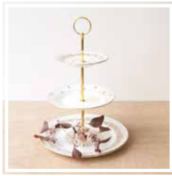
26348 ETAGERE 3-STÖCKIG WEISS-GOLD Höhe 30-35 cm