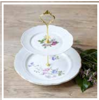
26036 ETAGERE 2-STÖCKIG GEBLÜMT Höhe 20-22 cm