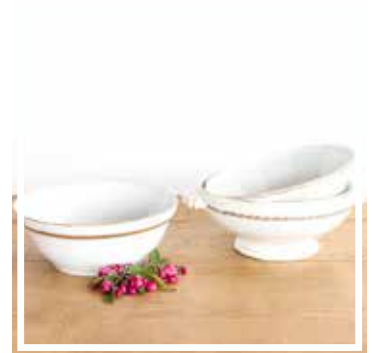
26315 SALATSCHÜSSEL WEISS-GOLD 25-28 cm