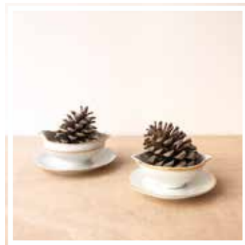
26446 SAUCIERE WEISS-GOLD