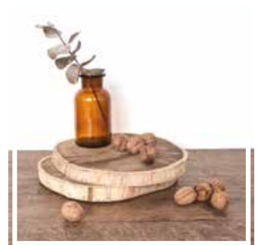
26821 HOLZSCHEIBE GROSSES FORMAT 36-40 cm