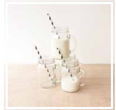
26615 MASON JAR BALL Inhalt 500ML