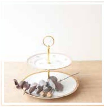
26347 ETAGERE 2-STÖCKIG WEISS-GOLD Höhe 20-22 cm