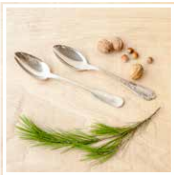
26050 SERVICELÖFFEL GROSS