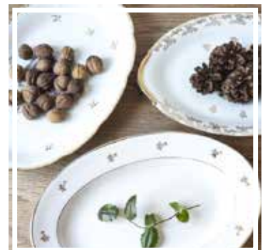
26445 PLATTE WEISS-GOLD 22-24 cm