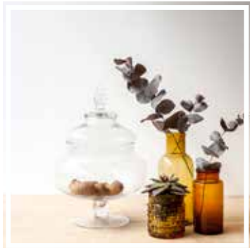
26627 BONBONNIERE MITTLERES MODELL