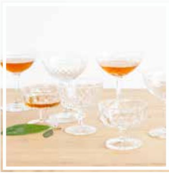
26138 SEKTGLAS KRISTALL Höhe 7-13 cm