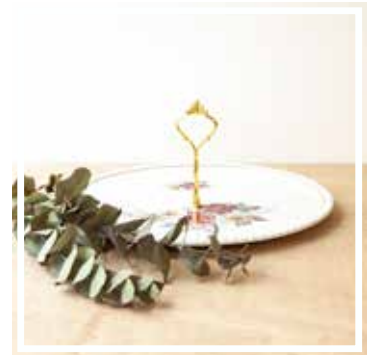
26437 KÄSEPLATTE GEBLÜMT 30-34 cm