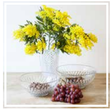
26054 SALATSCHÜSSEL GROSS