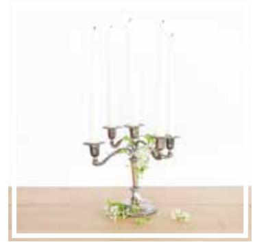
26135 KERZENLEUCHTER SILBER 2 bis 5 Kerzen