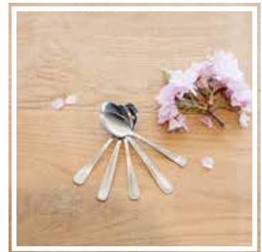
26046 LÖFFEL SILBER INOX