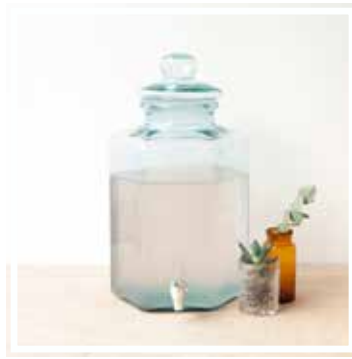
26312 BALLONFLASCHE MIT AUSSCHANK 11 Liter