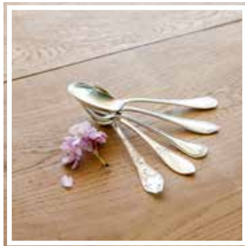
26330 VORSPEISENLÖFFEL SILBER