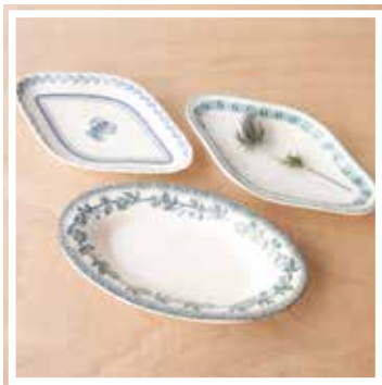
26075 VORSPEISENSCHÜSSEL BLAU-GRÜN 24-26 cm