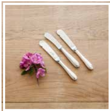
26478 BUTTERMESSER SILBER