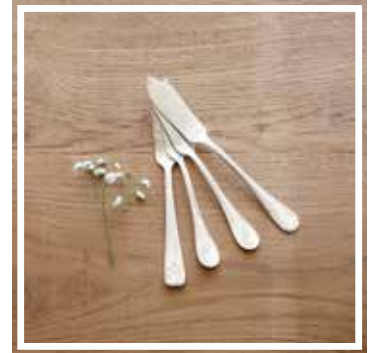
26337 FISCHMESSER SILBER