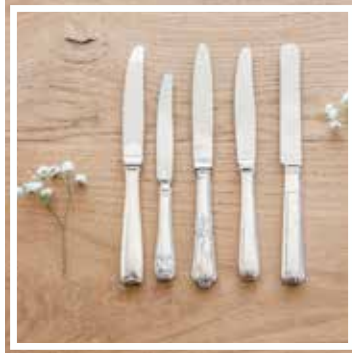
26327 VORSPEISENMESSER SILBER