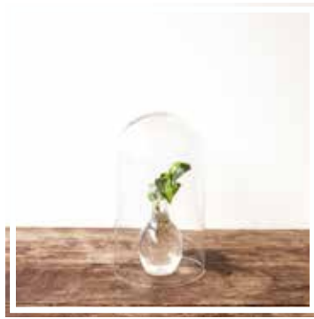
26680 GLASKUGEL MITTLERES FORMAT Höhe 28 cm