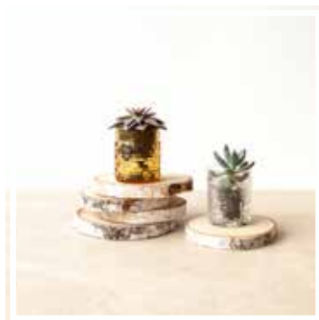
26669 HOLZSCHEIBE MITTLERES FORMAT 23-25 cm