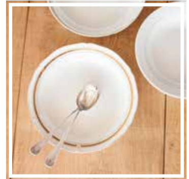
26336 PLATTE TIEF WEISS-GOLD 26-30 cm