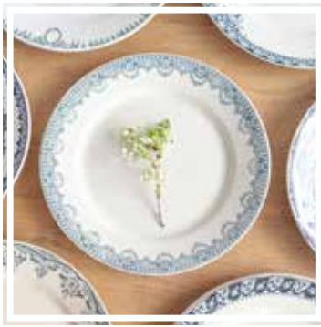
26048 TELLER BLAU-GRÜN GROSS 23-25 cm