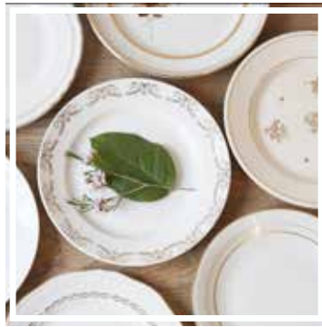
26049 TELLER WEISS-GOLD KLEIN 18-20 cm