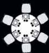
Table Ø 135 cm