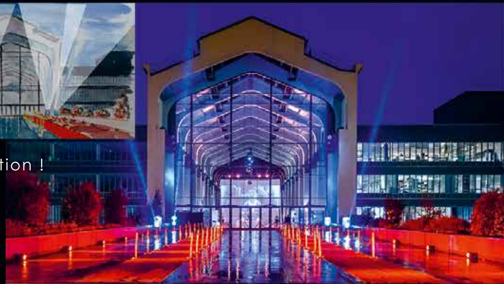
Chemin de moquette

Nous nous occupons des logos, des marquages, nous établissons les plans pour les autorisations, et de faire passer un bureau de contrôle.