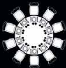
Table Ø 170 cm