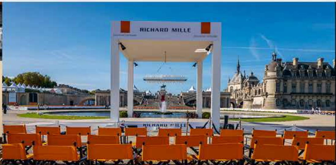
Défilés de voitures