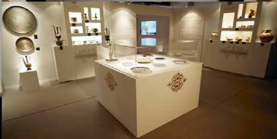
Mise en place d'objets d'Art