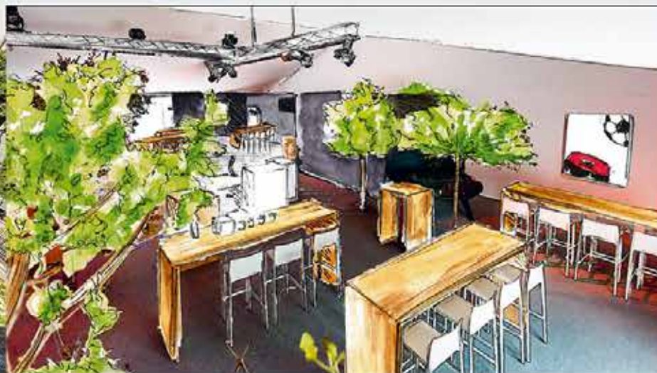
Imaginer des espaces de rencontres