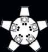
Table Ø 120 cm