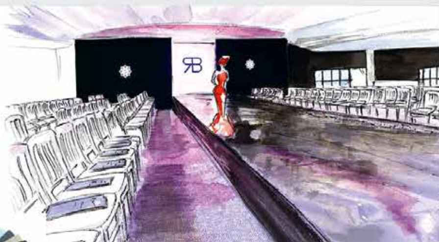
Défilé de mode