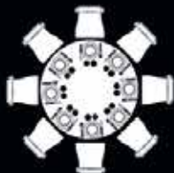
Table Ø 150 cm