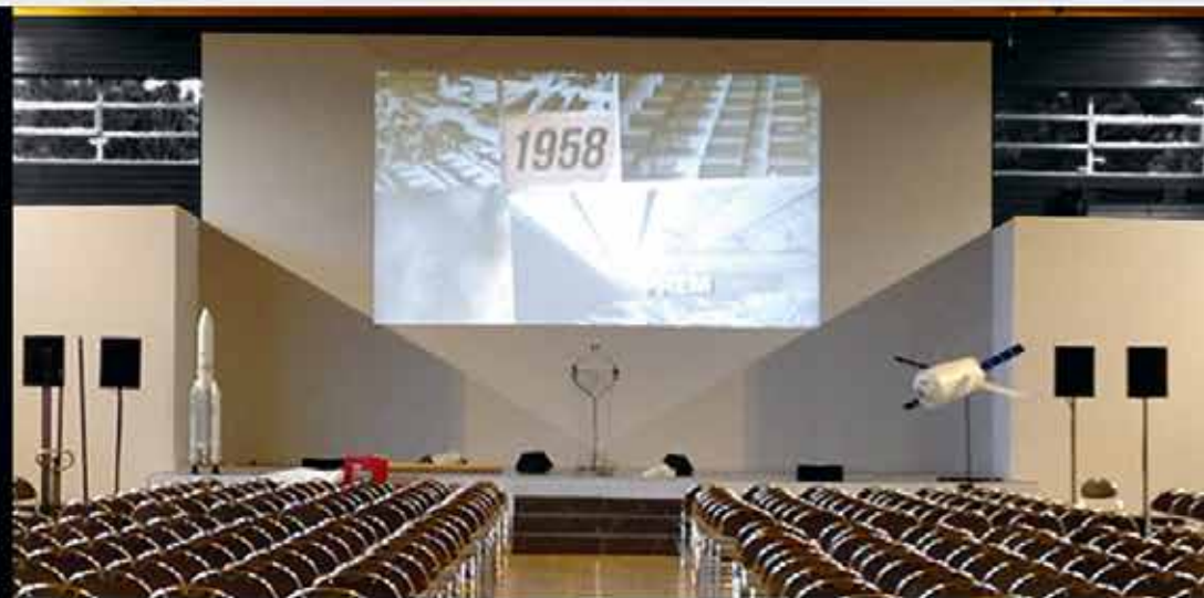
Discours, conférences, orchestre, meeting...