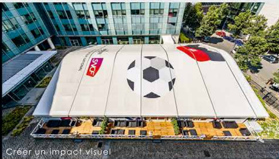
Créer un impact visuel