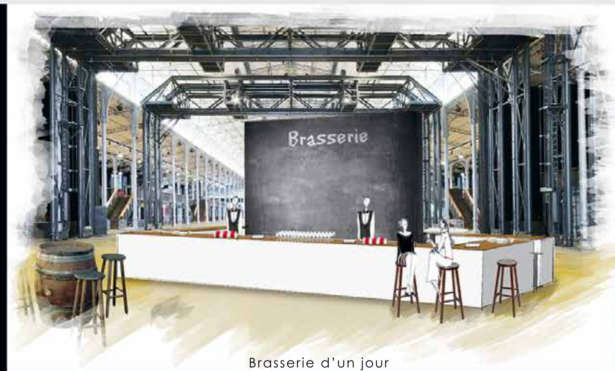
Brasserie d'un jour